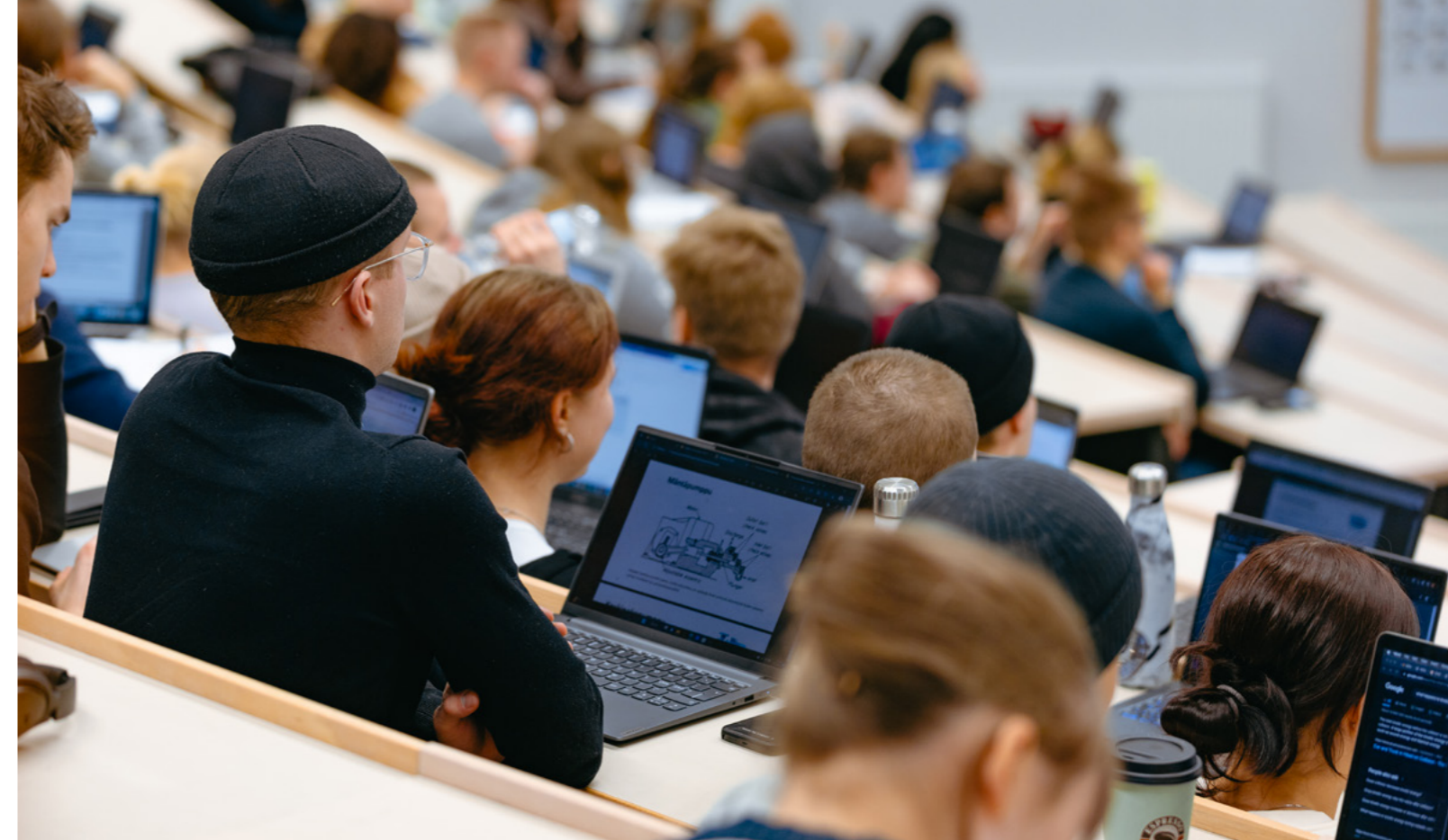
Valtakunnallisen kandidaattikyselyn pistekeskisarvo oli 3,85 (3,78). Aalto-yliopisto on asettanut kandidaattikyselyn pistekeskisarvon tavoitteeksi vähintään 4,1 vuonna 2024.

Tammikuussa 2023 järjestetyssä Summer Job Day -tapahtumassa Aalto-yliopiston opiskelijoilla oli mahdollisuus tavata työnantajia, esitellä omaa osaamistaan ja löytää itselleen kesätyöpaikka tai opinnäytetoimeksianto. Opiskelijoiden työelämäkontaktien luomiseksi marraskuussa järjestetty Aalto Talent Expo keräsi paikalle tuhansia opiskelijoita ja yli 100 työnantajaa. Syksyllä 2023 ensimmäistä kertaa järjestetty Aalto Thesis Fair -tapahtuma toi yhteen 13 yritystä ja yli 200 kansainvälistä opiskelijaa. Tapahtumassa Aalto-yliopiston