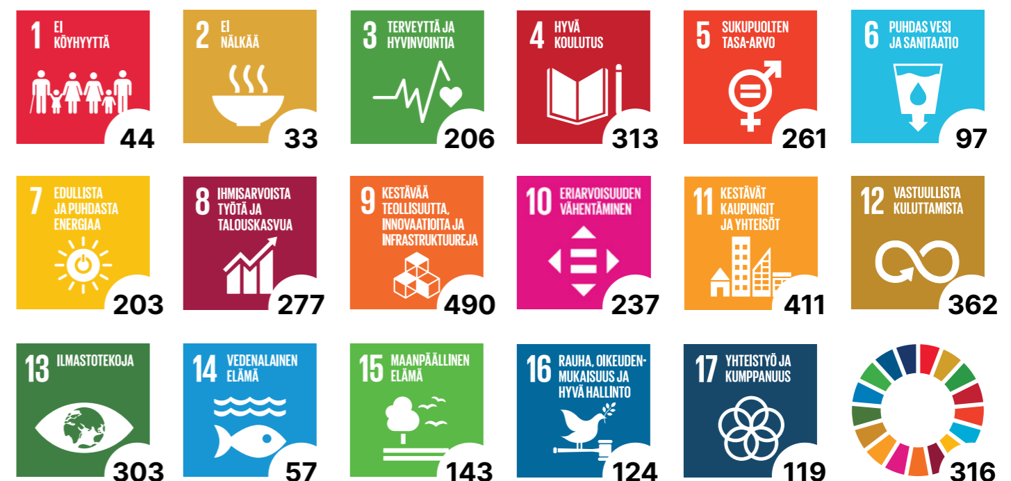
Ympäröidyt numerot ilmoittavat niiden kurssien lukumäärän, joilla käsitellään kyseistä YK:n kestävän kehityksen tavoitetta. Viimeisen kuvan luku 316 kertoo niiden kurssien määrän, joissa käsiteltiin kestävää kehitystä kokonaisuutena. Tiedot vastaavat vuosille 2022–2024 tehtyä opetus suunnitelmaa.

Aalto EE tarjoaa monipuolista ja laadukasta johdon koulutusta ja täydennyskoulutusta. Financial Timesin liikkeenjohdon koulu-tusta tarjoavien arvioinnissa Aalto EE on jo pitkään kuulunut liikkeenjohdon kouluttajien yhden prosentin parhaimmis-toon koko maailmassa.