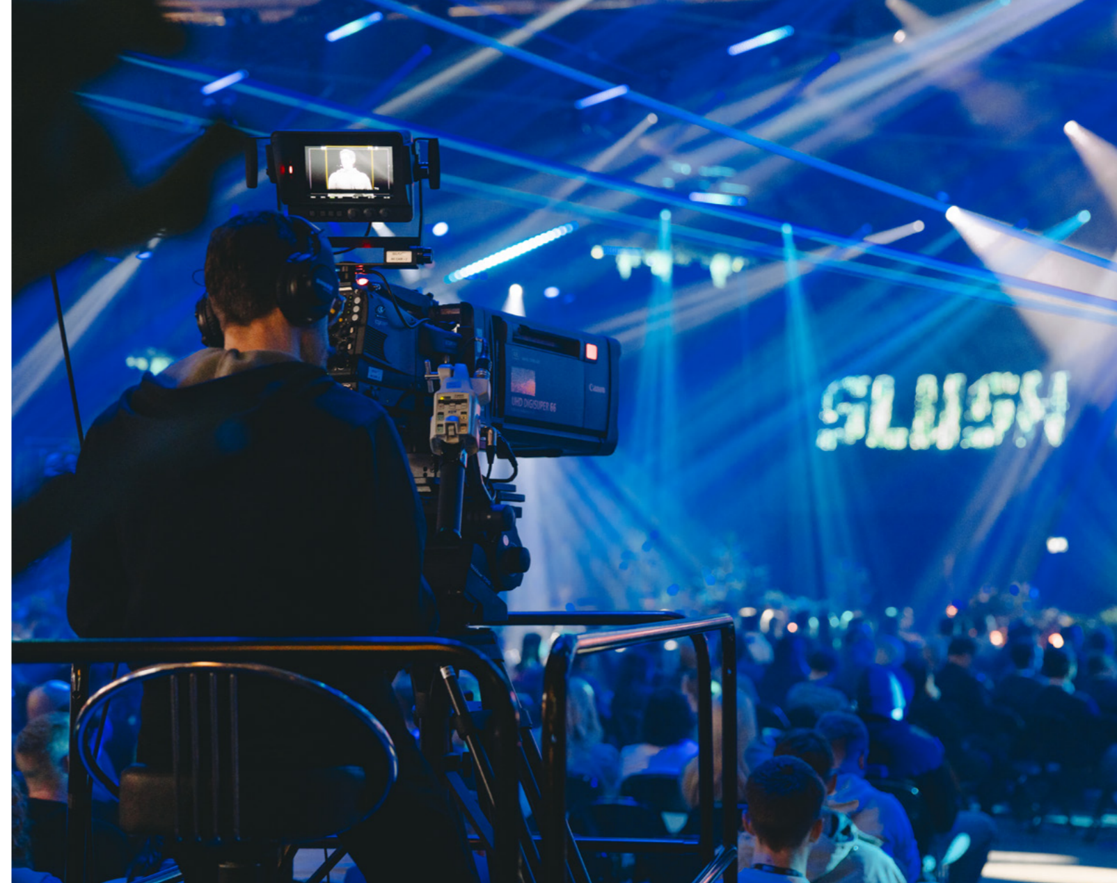
Slush 2023: Maailmaa muuttavien innovaatioiden lisäksi Aalto-yliopiston osastolla oli mahdollista tutustua myös Slushin syntyhistoriaan yliopiston opiskelijoiden opastuksella.

Otaniemessä sijaitseva EIT-innovaatioyhteisöjen (Knowledge and Innovation Communities KIC) keskittymä on poikkeuksellinen koko Euroopassa. Laaja EIT-yhteistyö antaa Aalto-yliopiston ympärille syntyneelle innovaatio- ja yrittäjyys ekosysteemille merkittävän, kansainvälisen ulottuvuuden. Esimerkkejä Aalto-yliopiston piiristä syntyneistä menestystarinoista ovat muun muassa IQM, ICEYE ja loncell.