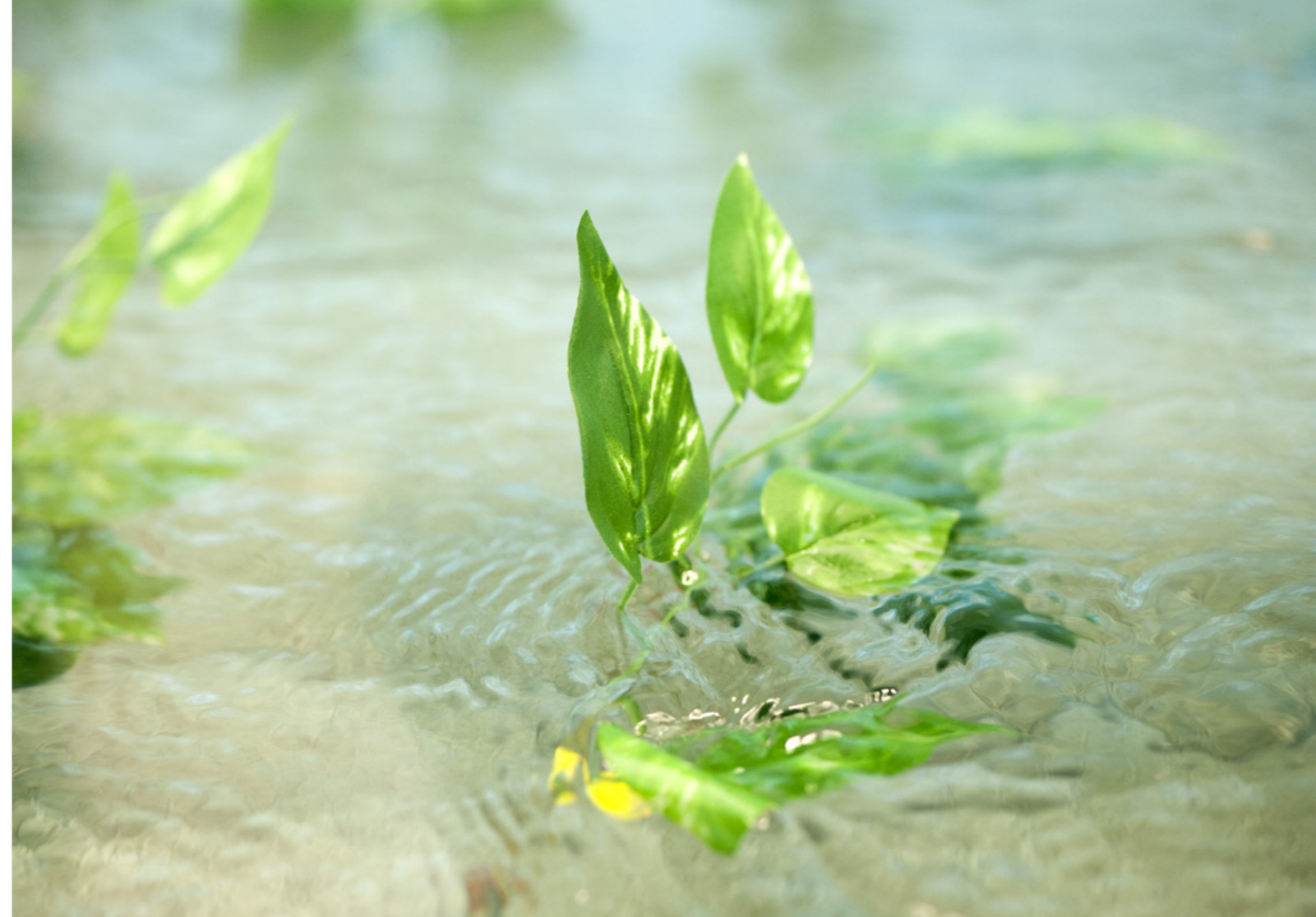
Aalto-yliopiston vetyinnovaatiokeskus kokoaa yhteen monitieteisen, huippulaatuisen vetytutkimuksen ja luo Suomesta houkuttelevan kohteen alan kansainvälisille osaajille ja investoinneille.

Suomen Akatemia valitsee tutkimuksen huippuyksiköiksi uudistumiskykyisiä, tieteellisesti erittäin korkeatasoisia ja yhteiskunnallisesti vaikuttavia tutkimusyhteisöjä. Huippuyksiköt uudistavat tutkimusta, kehittävät luovia tutkimusympäristöjä ja innovaatioita sekä kouluttavat uusia lahjakkaita tutkijoita suomalaiseen tutkimus- ja elinkeinoelämään. Vuonna 2023 Aalto-yliopistossa toimi seitsemän (7) Suomen Akatemian rahoittamaa tutkimuksen kansallista huippuyksikköä, joista kolme (3) on valittu rahoituskaudelle 2018–2025 ja neljä (4) rahoituskaudelle 2022–2029. Aalto-yliopisto johtaa näistä kolmea: Kvanttitekniikka (QTF), Suurnopeuksiset sähkömekaaniset energianmuunnosjärjestelmät (HiECSs) sekä Elävien toimintojen innoittamat hybridimateriaalit (LIBER). Lisäksi Aalto-yliopiston tutkimusryhmät osallistuvat kumppaneina huippuyksiköihin Satunnaisuuden ja rakenteiden tutkimus (FIRST), Virtuaalinen laboratorio ilmakehän molekyyllitason reaktioille ja faasimuutoksille (VILMA), Inversiomallinnus ja kuvantaminen sekä Kestävä avaruustiede ja -tekniikka.