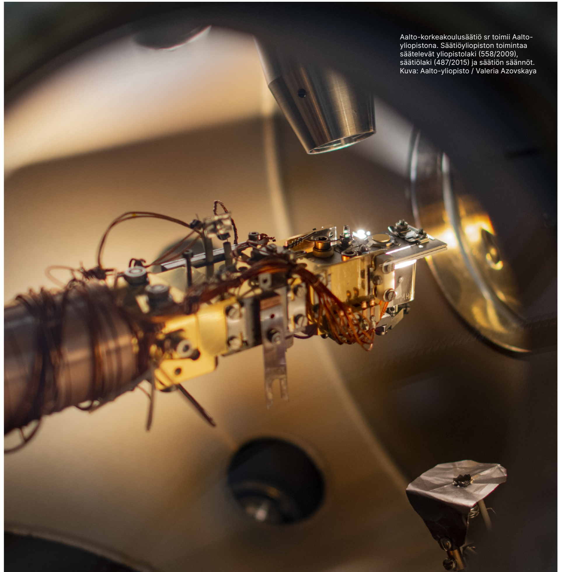
Aalto-korkeakoulusäätiö sr toimii Aalto-yliopistona. Säätiöyliopiston toimintaa säätelevät yliopistolaki (558/2009), säätiölaki (487/2015) ja säätiön säännöt.

Yliopisto noudattaa kaikessa toiminnassaan kansainvälisesti korkeatasoisen yliopisto-toiminnan eettisiä periaatteita ja hyvää hallintotapaa sekä turvaa sisäisessä hallinnossaan opetuksen, tutkimuksen ja taiteen vapauden edellyttämän akateemisen itsehallinnon ja siihen olennaisesti kuuluvan professorikunnan riippumattomuuden.