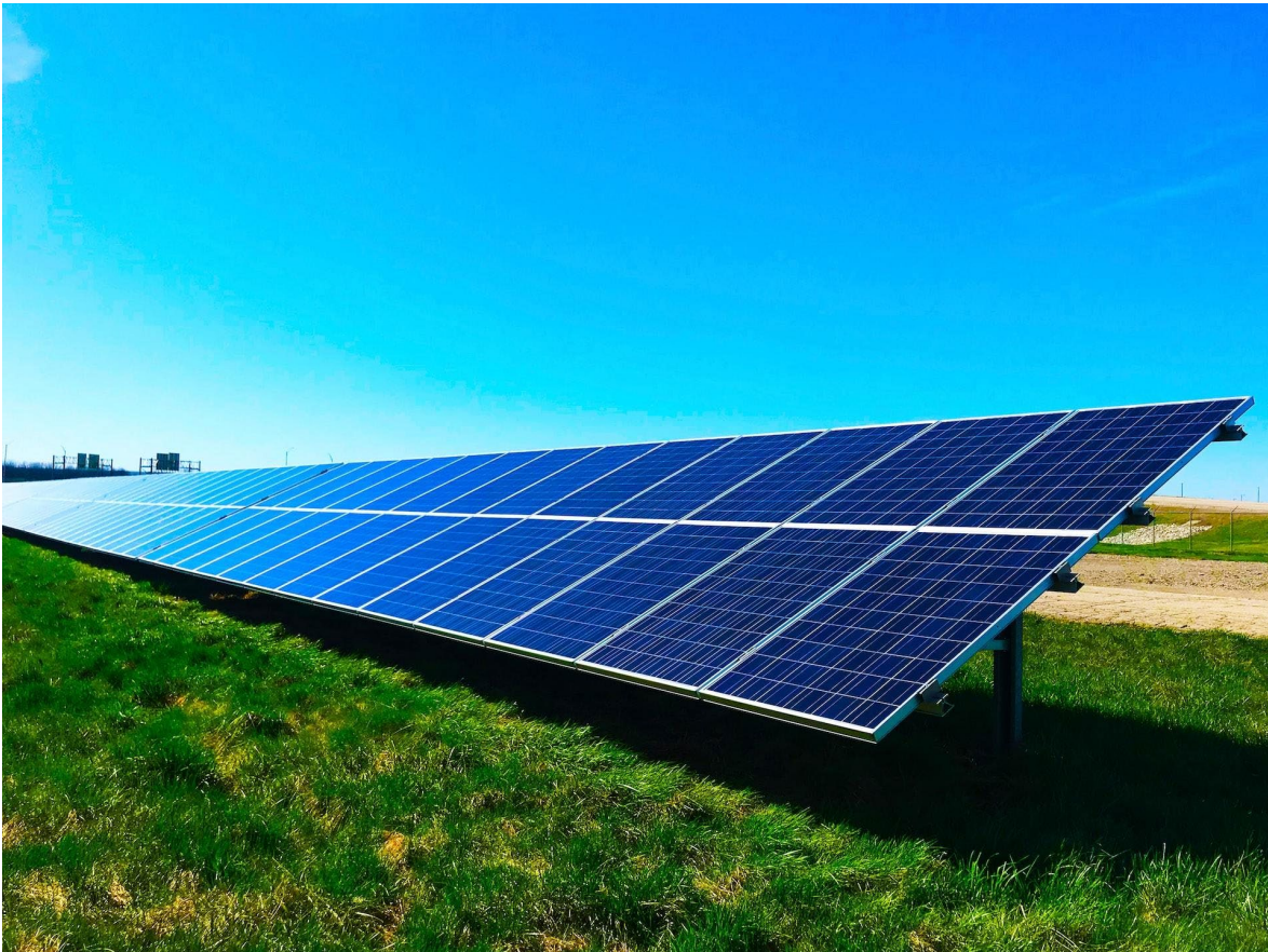
Kuva 1:

AVAINSANAT: Aurinkokenno, sähkö, fotoni, energia, teknologia