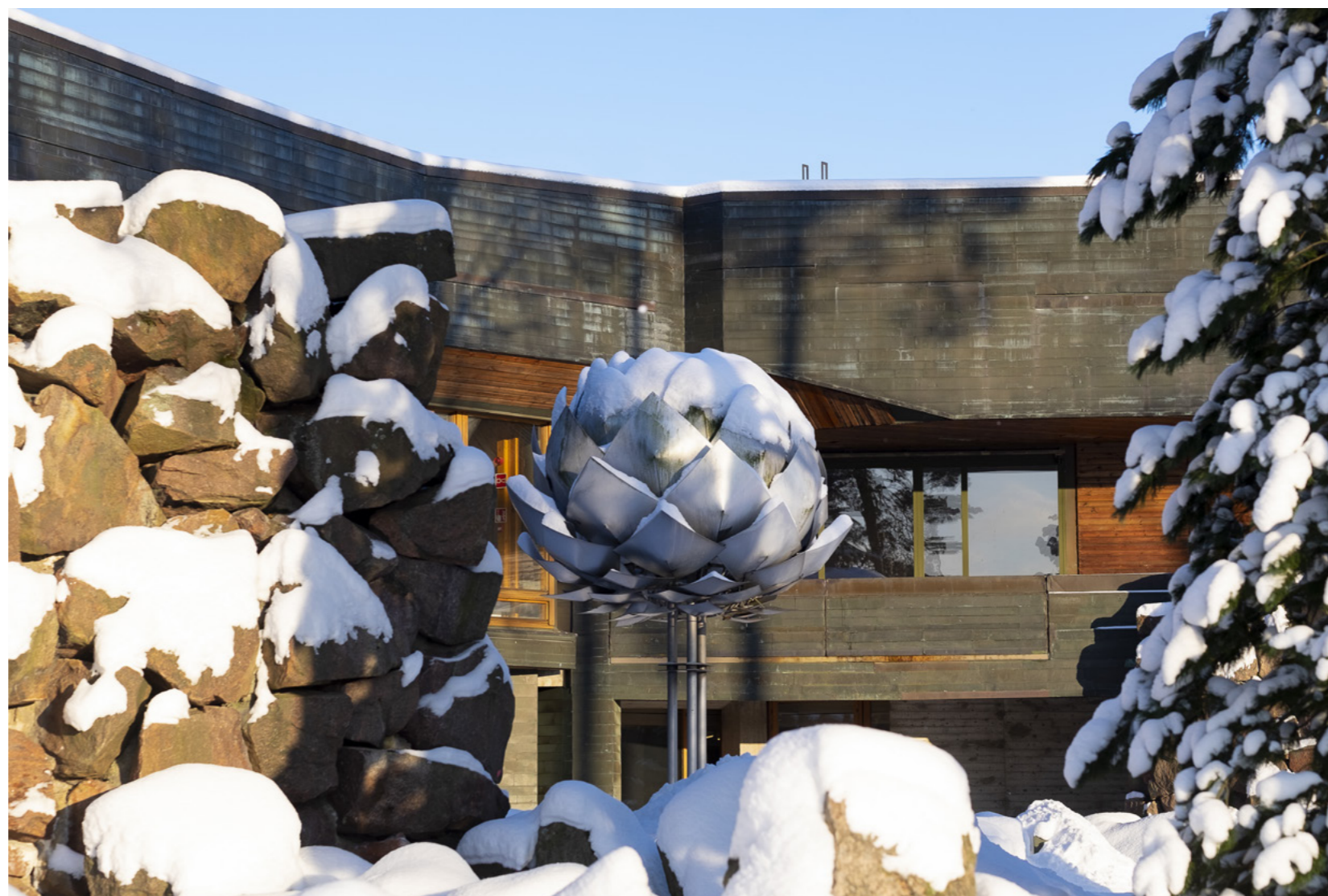
Aalto-korkeakoulusäätiö sr toimii Aalto-yliopistona. Säätiöyliopiston toimintaa säätelevät yliopistolaki (558/2009), säätiölaki (487/2015) ja säätiön säännöt.

Yliopisto noudattaa kaikessa toiminnassaan kansainvälisesti korkeatasoisen yliopistotoiminnan eettisiä periaatteita ja hyvää hallintotapaa sekä turvaa sisäisessä hallinnossaan opetuksen, tutkimuksen ja taiteen vapauden edellyttämän akateemisen itsehallinnon ja siihen olennaisesti kuuluvan professorikunnan riippumattomuuden.